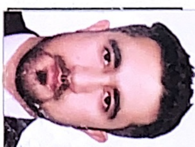
V-President / مرستیال